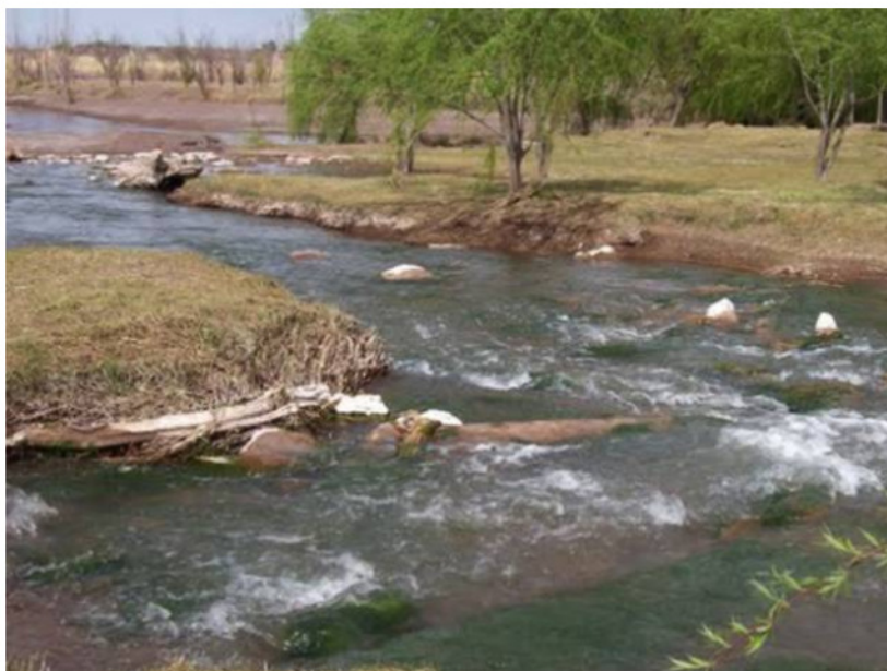
LA PAMPA Y MENDOZA MANTIENEN DESDE HACE AÑOS UNA PUJA POR LAS AGUAS DEL ATUEL.